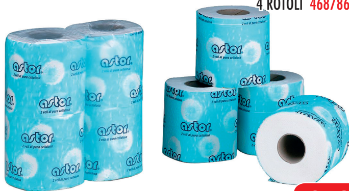
ASTOR IGIENICA FASCETTATA 4 ROTOLI 46878602/24