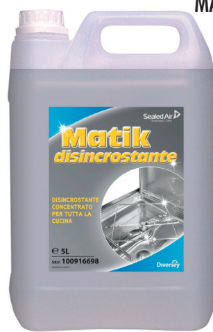
MATIK DISINCROSTANTE ML 5000 43336223/1