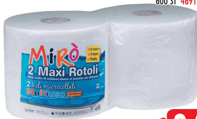
BOBINA MIRO' EXTRA 600 ST 46918601/2