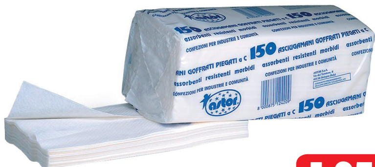
ASTOR ASCIUGAMANO PIEGATI a C x150 46918604/24