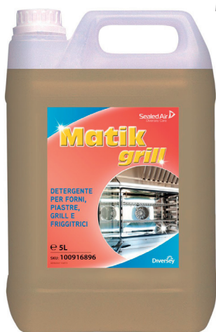
MATIK GRILL / FORNO ML 5000 43336228/1