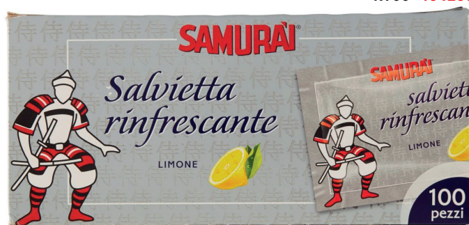
SAMURAI SALVIETTA RISTORAZIONE x100 46428918/1