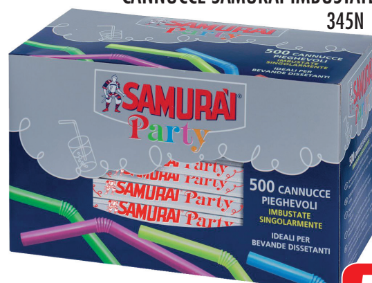
CANNUCCE SAMURAI IMBUSTATE 500 PEZZI 345N 47052814/1