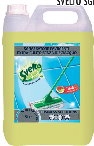
SVELTO SGRASSATORE PAVIMENTI ML 5000 43336220/1