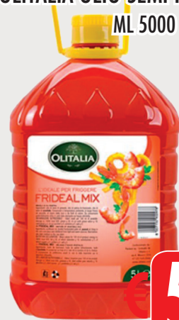
OLITALIA OLIO SEMI FRIDEALMIX ML 5000 22614430/2