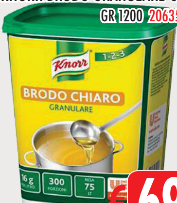
KNORR BRODO GRANULARE CHIARO GR 1200 20635504/1