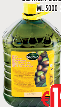
OLITALIA OLIO OLIVA PET ML 5000 22538808/2