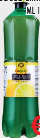
SUCCO LIMONE RAUCH PET ML 1000 22756300/6