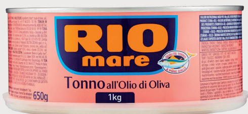
TONNO RIO MARE GR 1000 22012020/1