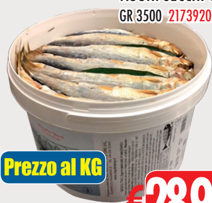
AGONI SECCHI C.A. GR 3500 21739202/1